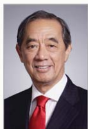
香港交易所主席 夏佳理