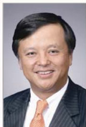
香港交易所集团行政总裁 李小加