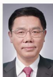
中国工商银行董事长 姜建清