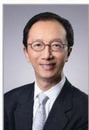
黑石集团大中华区主席 梁锦松